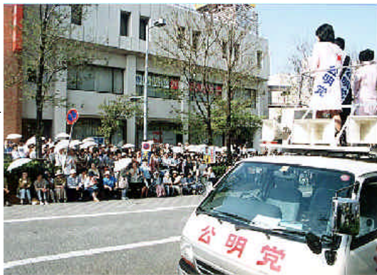
浜四津代表代行を迎えた取手市での街頭演説（619）

銘じて、「国民のため」「大衆とともに」の精神を片時も忘れることなく、まずは公約の実現に全力を挙げるとともに、我が地域・茨城県の発展と、二十一世紀の「新しい日本」を築く闘いの先頭に立つことを、改めて