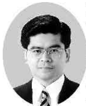
衆議院議員 党副幹事長・県本部代表 石井 啓一

私ども公明党は、比例区で過去最高の七七六万票の得票をいただき、茨城県の一六万五七三三票も過去最高得票となりました。その結果、小選挙区で七人、比例区で二四人の合計三一人が当選し、北関東ブロックで