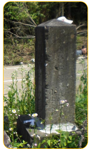
登山口にある慶応2年の標識