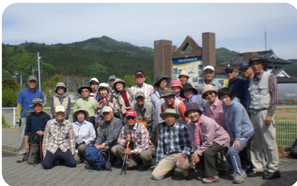
里美ふれあい館駐車場にて 出発前集合写真 (背景の山は鍋足山)