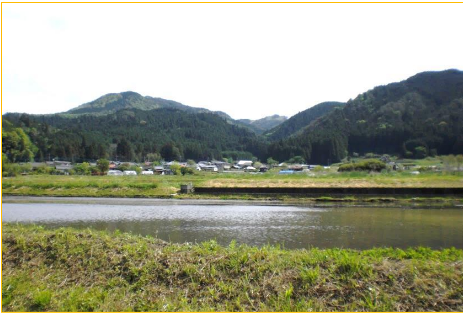
里美の里山風景（里美富士方面）