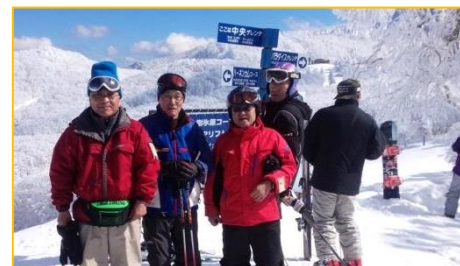
中央グレンデ付近にて スキー組 蔵王地藏尊にて これからザング坂を滑って・・・