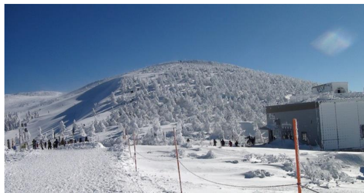
山頂駅付近から臨む地藏山 地藏山斜面の樹氷とそのシルエット （見事な青空！！）