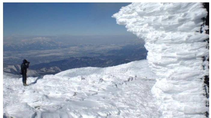
山頂標識に付着した「エビのシッコ」 地藏山より深い雪の中を下る（歩きにくいようですね）