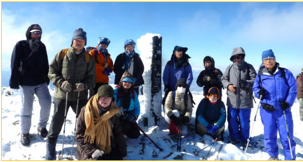
地藏山（標高：1,736m）にて 風が強く冷たい(最高齢者 米寿を過ぎた方もいます) まるで運動会で組体操のピラミッドを作っているようだ