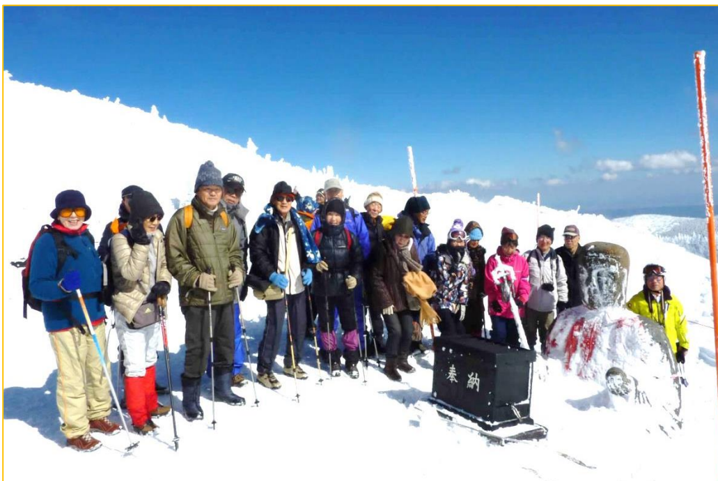
樹氷観賞組 蔵王地藏尊にて記念撮影 これから地藏山山頂へ